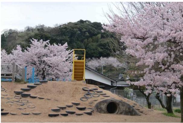
ごんげん山や校庭の桜が開きました。

あいさつを交わすことは、“ あなたは私にとって大切な人 ”と相手の存在を認めることであり、あいさつで、「 今日も一日元気ががんばろう 」と自分の力にもなります。そして、湯田を愛する・湯田をもっといい地域にしたいと地域への温かいまなざしを育てます。私も、毎朝、正門の前で子ども達の登校を見守りながら、心を込めてあいさつをしたいと思います。