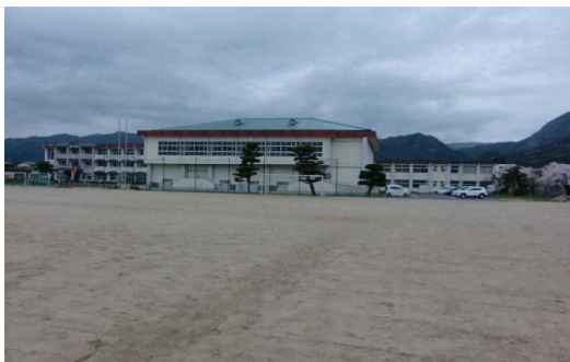
ごみが落ちていない運動場 すばらしいですね。