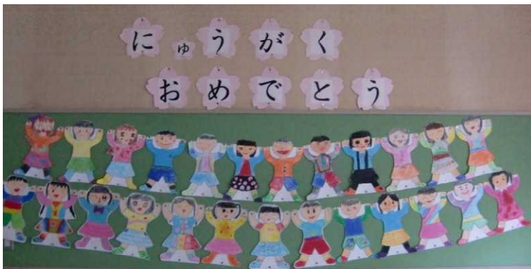
入学式の準備も整いました。お祝いメッセージもたくさんいただきました。