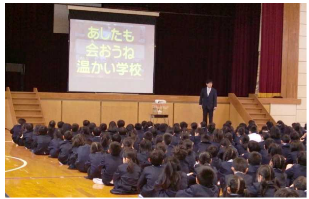
始業式では、みんなで約束をしました。